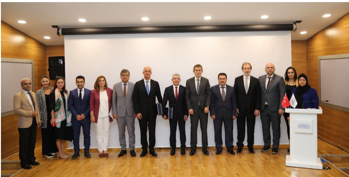
Día Mundial Metropolitano de Gaziantep