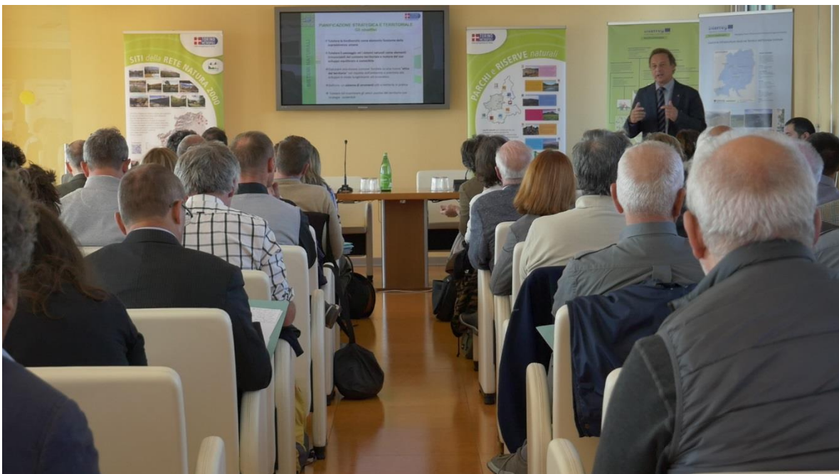
Reunión de líderes de la Ciudad Metropolitana de Turín

El 7 de octubre, la Ciudad Metropolitana de Turín (Italia), compuesta por 312 municipios, celebró su evento del Día Metropolitano con la presencia de varios representantes políticos, autoridades locales, académicos y profesionales. En el encuentro, que se enfocó en los ODS 12 y 15, se discutió sobre infraestructuras verdes, conectividad ecológica, preservación y especies protegidas, y políticas urbanas-rurales-montañosas para preservar los bienes ambientales y comunes.