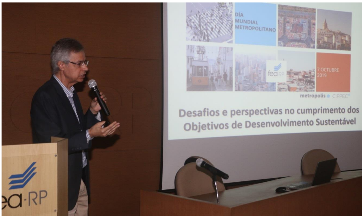
"Desafios e perspectivas no cumprimento dos Objetivos de Desenvolvimento Sustentável (ODS)"

El primer evento convocado por una institución académica tuvo lugar en Ribeirão Preto (Brasil). Durante el 7 de octubre, expertos de la Facultad de Economía, Administración de Empresas y Contabilidad de la Universidad de São Paulo (FEARP-USP) analizaron las decisiones e iniciativas tomadas por el Consejo de Desarrollo de la Región Metropolitana de Ribeirão Preto - instancia de gobernanza del área metropolitana - en base a los ODS 3, 4 y 11.