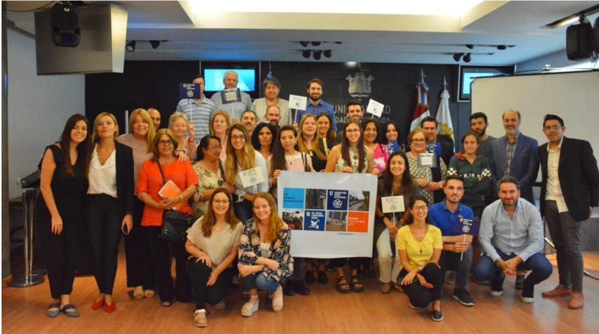
Evento del Gran Córdoba