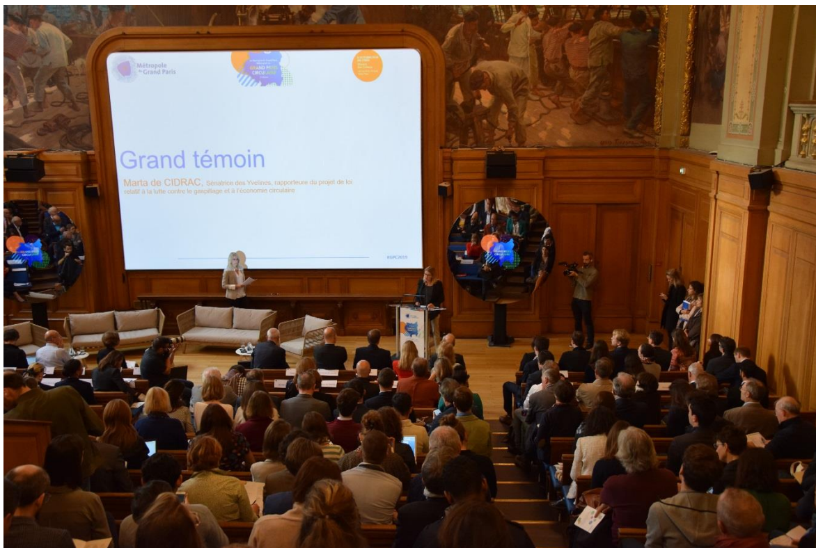
Grand Paris Circulaire (Foto: Metr polis del Gran Paris)

La metrópolis del Gran París (Francia) fue la primera en celebrar su evento del Día Mundial Metropolitano. El día 3 de octubre, el ente regional organizó el Grand Paris Circulaire , un encuentro sobre economía circular y sus desafíos metropolitanos, que abordó los SGD 8 y 11, del que participaron distintos funcionarios, empresas, asociaciones y expertos del Gran París.