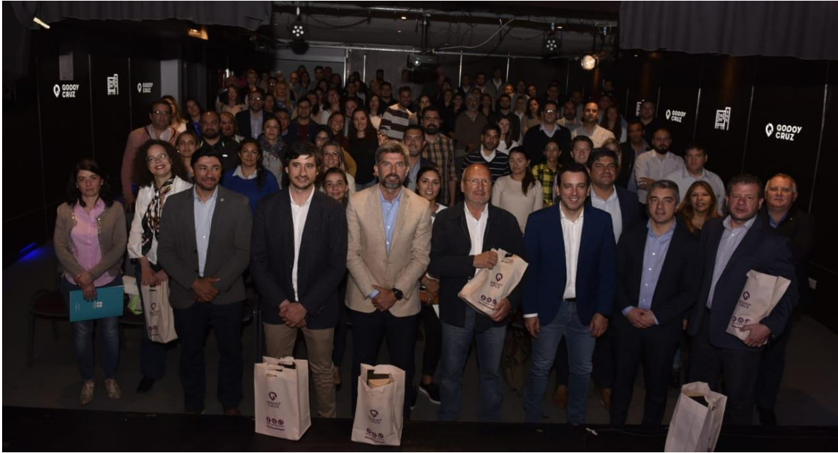
Día Mundial Metropolitano en el Gran Mendoza