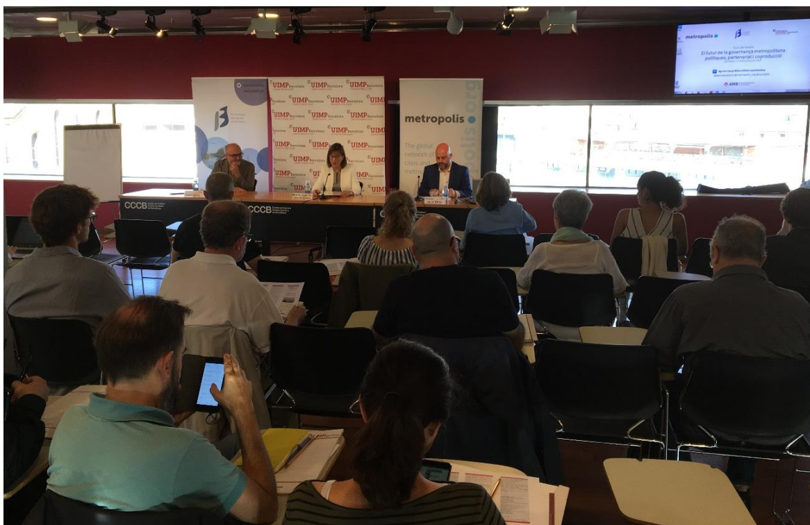
"El futuro de la gobernanza metropolitana: políticas, asociaciones y coproducción"

En Barcelona (España), Metrópolis y el Plan Estratégico Metropolitano de Barcelona (PEMB) organizaron el curso "El futuro de la gobernanza metropolitana: políticas, asociaciones y coproducción", con el apoyo del Área Metropolitana de Barcelona (AMB). El evento transcurrió durante los días 7 y 8 de octubre, y trató sobre el estado actual y el futuro de la gobernanza metropolitana en relación con la implementación de los ODS a través de alianzas plurisectoriales clave (ODS 17).