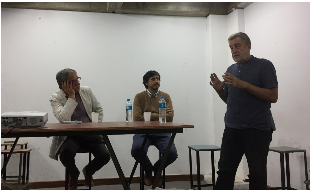
“Innovación en la gestión de suelo urbano y planificación territorial”

En la Ciudad de Buenos Aires (Argentina), el evento del Día Mundial Metropolitano fue iniciativa del sector académico. El día 8 de octubre, la Facultad de Arquitectura, Diseño y Urbanismo de la Universidad de Buenos Aires organizó una conferencia, vinculada al ODS 11, para crear conciencia sobre cómo la planificación metropolitana juega un papel fundamental en la construcción de ciudades seguras, inclusivas, sostenibles y resilientes. Allí, distintos académicos concluyeron que las herramientas de manejo del suelo pueden generar grandes externalidades positivas al promover una urbanización ordenada, inclusive en contextos de bajos ingresos. Además, destacaron el rol clave que cumplen los mecanismos de coordinación y los espacios para el diálogo interjurisdiccional a la hora de gestionar los servicios metropolitanos comunes.